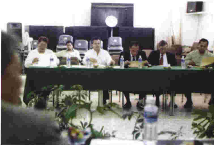
La convocatoria para las licitaciones fué atendida por varias empresas nacionales y locales

Esta cantidad se dividió, como lo previene la ley, en dos partes iguales: una que corresponde al financiamiento público anual para el sostenimiento de las actividades ordinarias y que ascendió, por tanto, a la cantidad de 30 millones 463 mil pesos; y la otra destinada a los gastos de campaña y equivalente a la cantidad mencionada.