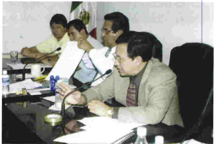
La adquisición de bienes y servicios para el Proceso Electoral 2001 fue sometido a licitación pública nacional

La distribución, de acuerdo a lo que dispone la ley, se hizo del modo siguiente: el 30 por ciento del financiamiento se asigna por partes iguales a todos los partidos; y el 70 por ciento restante se distribuye en proporción directa a los votos que hayan obtenido los partidos en la última elección de diputados locales.